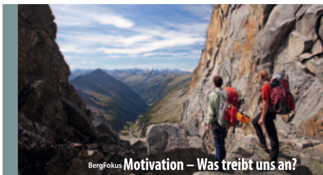
BergFokus Motivation – Was treibt uns an?