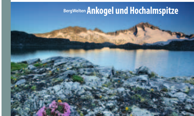
BergWelten Ankogel und Hochalm Spitze

Hätten Sie gewusst, dass die Wiege des Alpinismus am Ankogel steht? Bereits um 1762 – also gut 20 Jahre vor der Erstbesteigung des Mont Blanc, die gemeinhin als die Geburtsstunde des Alpinismus gilt – soll „der alte Patschg“, ein einfacher Bauer aus dem Bocksteiner Anlaufstal, den 3250 Meter hohen Tauerngipfel bestiegen haben.